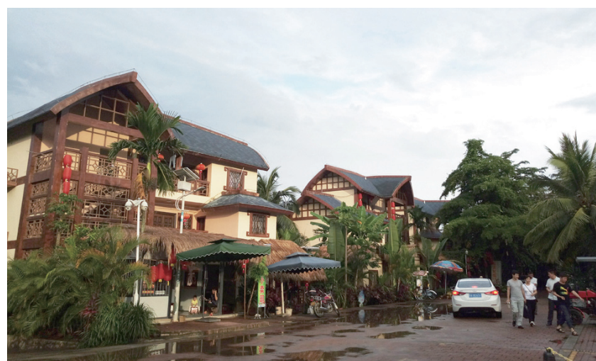
海南保亭什进村村民的别墅式小楼。

郑聪辉表示，目前“大三亚”旅游合作示范区已经初见雏形。“大三亚”旅游经济圈构建了基础设施和公共服务资源一体化，逐步打通四市县交通衔接瓶颈；打造了区域统一的旅游品牌体系，推广大三亚旅游目的地品牌；推动旅游线路产品一体化，积极打造精品旅游线路，今年已经将10条覆盖各市县旅游资源的精品线路产品推向市场；将旅游执法一体化，铸造放心游“大三亚”区域旅游目的地。“今年前8月，三亚游客接待量增长15%，而保亭、乐东、陵水等市县游客接待量也实现大幅度增长。”