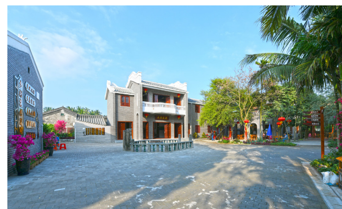
琼海市博鳌镇南强村古巷老宅老味道。

2000年，他从东南亚投资市场转向海南，从创业初期的年营业额近30万元（人民币，下同）到如今的6000多万元，从15名工人发展到200多人，“海南良好营商环境、内地开阔的市场，为我们提供了商机。”高文龙说，正在建设国际旅游岛的海南是他的福地。 张茜翼 王晓斌